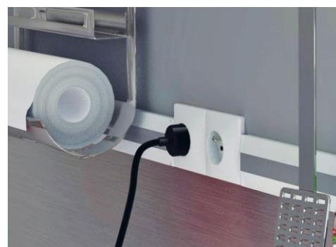
Profitez en pour passer vos câbles

Vous pouvez choisir votre décoration dans notre gamme standard disponible en longueurs 100 cm ou 200 cm à insérer entre deux carreaux par exemple et déclinés en 2 finitions modernes et tendances « un aspect Inox brossé et un aluminium anodisé ». Nos profilés couvrent la gamme de carrelage, faïence ou mosaïque des épaisseurs 6 à 11 mm.