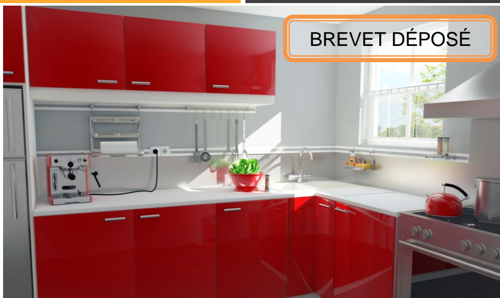
Votre cuisine avec les profils de décoration TurnToFix

handicap. Nous avons également des critères stricts de qualité, nos partenaires répondent aux exigences de la norme ISO 9001. Les finitions bénéficient du label qualanod (qualité extérieure).